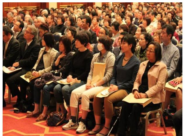
最前列で講演を熱心に聴くカーリング日本代表・北海道銀行チームの選手たち