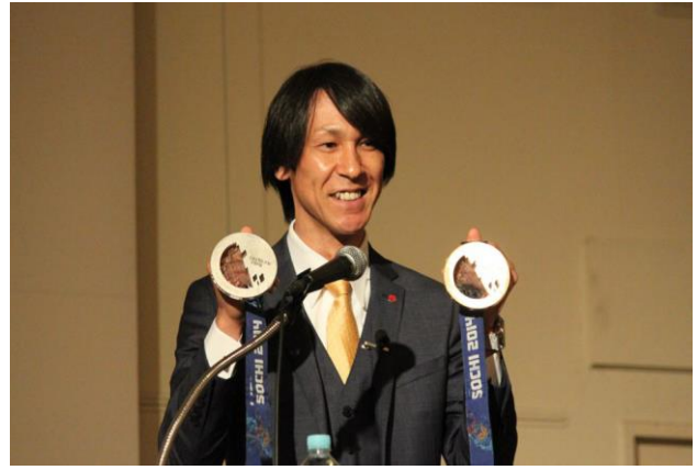
講師 土屋ホームスキー部監督兼選手 葛西 紀明さん