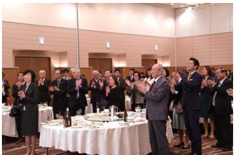
講師、大会参加者、医師、経済界、国会議員など 160 人が出席