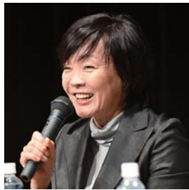
内閣総理大臣令夫人 安倍 昭恵氏