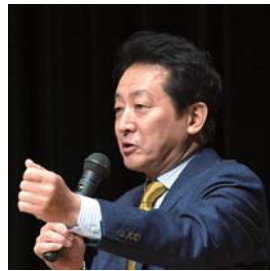
俳優 辰巳 琢郎氏